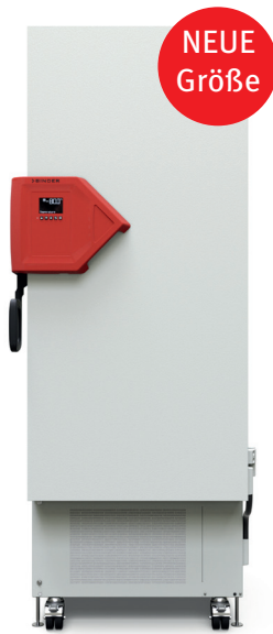
Modell UFV 350

Der BINDER Ultratiefkühlschrank sorgt für die sichere Lagerung von Proben bei -90 °C. Er vereint herausragende Umweltfreundlichkeit mit niedrigem Energieverbrauch, komfortabler Bedienung und einem individuellen Sicherheitskonzept.