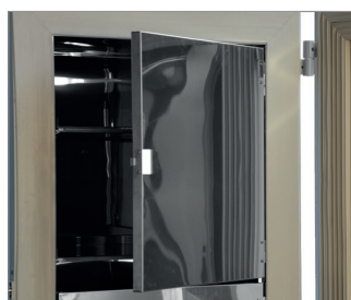
Ausgeschäumte Kompartimenttüren mit Dichtung