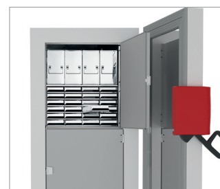
Auswahl an Gestellen und Boxen